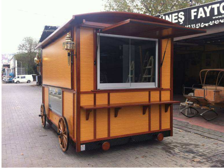
Önden Görünüm/ Front View